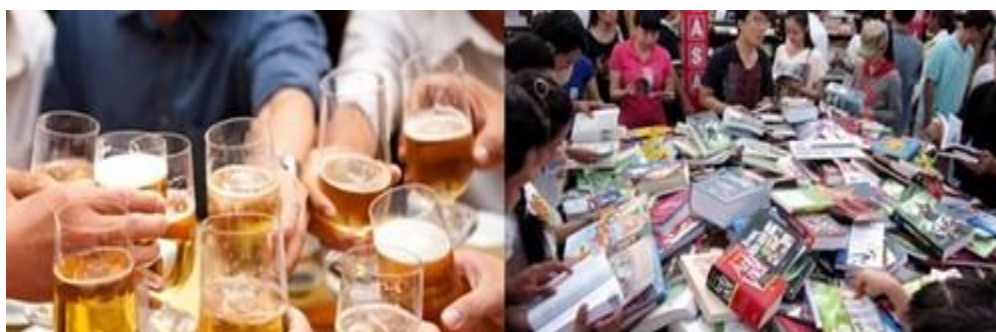
“Nhậu” nhiều, đọc ít và sự lên ngôi của văn hóa rẻ tiền

Người Việt chi ra 3 tỷ đô la để tiêu thụ 3 tỷ lít bia mỗi năm, nếu chia đều trên bình quân dân số mỗi người từ mới lọt lòng đến gần về thiên cổ sẽ “gánh” hơn 33 lít!. Một con số kinh hoàng, không sai nếu xếp bia rượu vào quốc nạn, nhớ ngày xưa Bác Hồ nói thực dân Pháp đầu độc dân tộc ta bằng rượu cồn... thì nay chúng ta đã tự mua cò đầu độc chính mình.